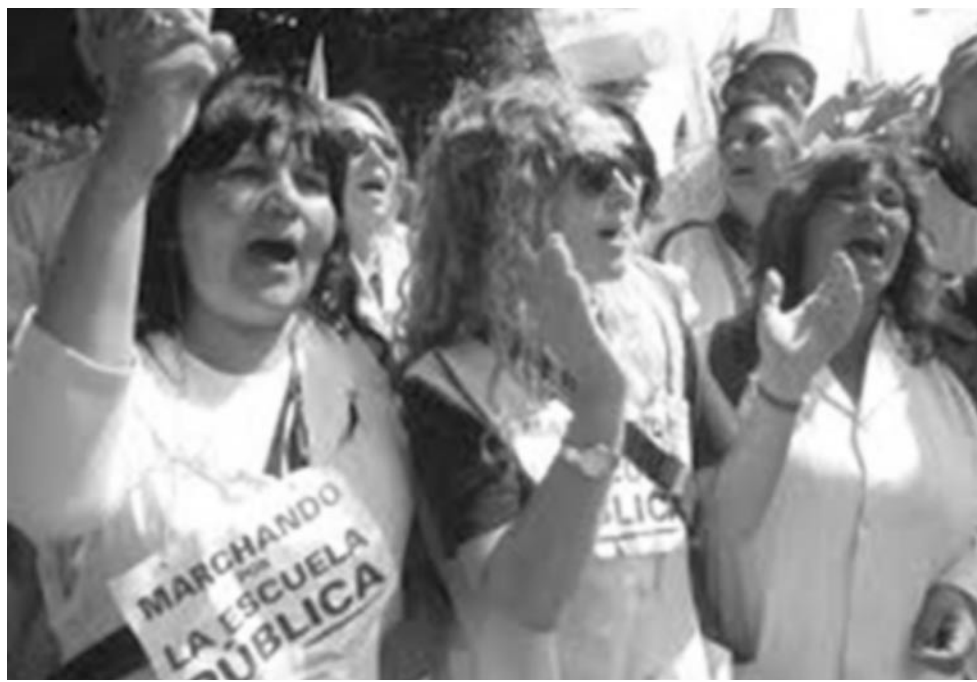
Docentes Autoconvocadas Bonaerenses

Por eso, hartas de las mentiras de los funcionarios y de la traición de la dirigencia sindical que está con el gobierno, pudimos superar la bronca, la angustia y desesperación individual, con la unidad y la lucha colectiva.